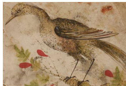
Suiveur de Giovanni da Udine (XVI e siècle) Oiseau , sans date plume, encre brune et gouache sur vélin, 12,7 × 20 cm Musée Jenisch Vevey – Centre national du dessin Legs Anne-Marie Zeerleder-Thormann