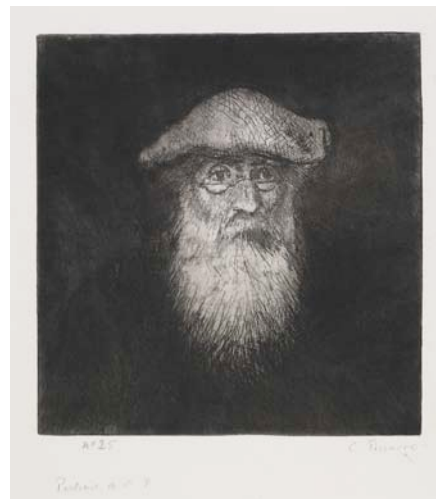
Camille Pissarro (1830-1903) Camille Pissarro par lui-même , 1891

Plume, encre brune et lavis brun sur mise en place au crayon de graphite ; filet à la plume et encre brune ; papier vergé crème ; 215 × 183 mm Musée Jenisch Vevey – Centre national du dessin, dépôt d'une collection particulière