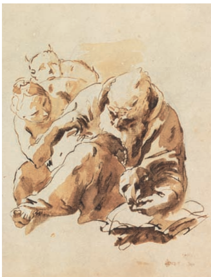
Giambattista Tiepolo (1696-1770) La Tentation de saint Antoine , 1730-1735

Plume, encre brune et lavis brun sur mise en place au crayon de graphite ; filet à la plume et encre brune ; papier vergé crème ; 215 × 183 mm Musée Jenisch Vevey – Centre national du dessin, dépôt d'une collection particulière