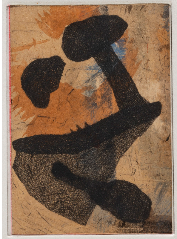
Claire Nicole (*1941), Estampe 14/21 , 2014, pointe sèche sur papier rehaussé à la peinture et appliqué sur papier vélin d'Arches, 149 × 105/ 383 × 280 mm (image/support), Collection de l'artiste