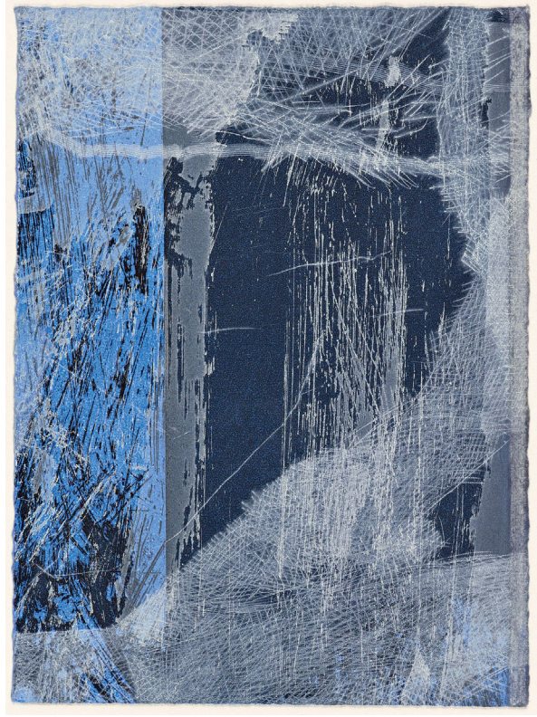
Claire Nicole (*1941), Estampe 12/20 , 2012, pointe sèche sur Japon préparé et appliqué sur papier vélin, 162 × 120/385 × 277 mm (image/support), Collection de l'artiste