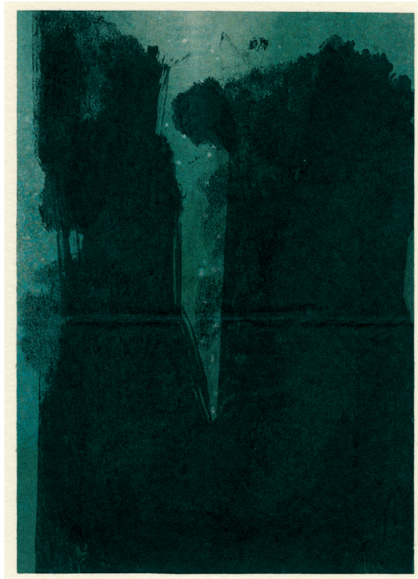
Claire Nicole (*1941), Sans titre , 2018, monotype sur papier contrecollé sur papier vélin, 148 × 105/361 × 255 mm (image/support), Collection de l'artiste