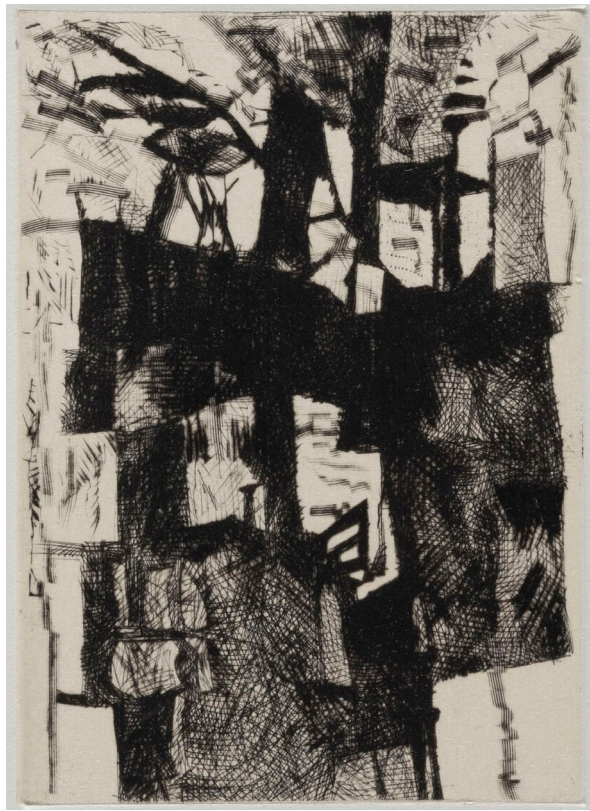
Claire Nicole (*1941), Estampe 08/2 , 2008, pointe sèche sur Chine appliqué sur papier vélin BFK Rives, 145 × 103/380 × 285 mm (image/support), Collection de l'artiste