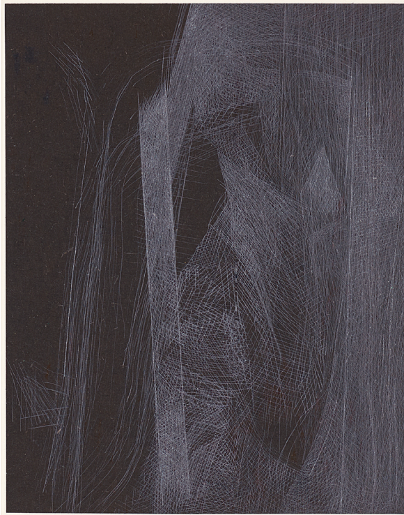
Claire Nicole (*1941), Estampe 98/4 , 1998, pointe sèche sur Chine noir appliqué sur papier vélin, 163 × 128/380 × 285 mm (image/support), Musée Jenisch Vevey – Cabinet cantonal des estampes, Collection de l'État de Vaud