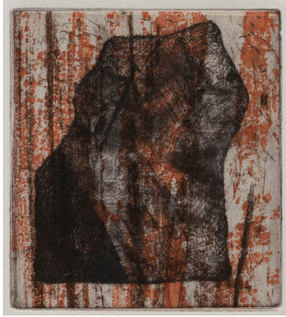
Claire Nicole (*1941), Estampe 14/16 , 2014, pointe sèche sur Chine préparé sur papier vélin, 90 × 80/281 × 221 mm (image/support), Collection de l'artiste