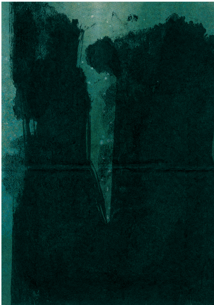
Claire Nicole (*1941), Sans titre (détail) , 2018, monotype sur papier contrecollé sur papier vélin, 148 × 105/361 × 255 mm (image/support), Collection de l'artiste

Une exposition du Cabinet cantonal des estampes à découvrir au Pavillon de l'estampe