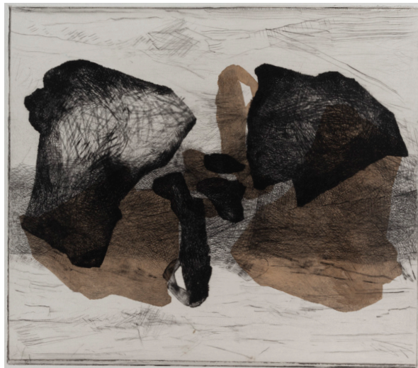
Claire Nicole (*1941), Métamorphose 08/9 , 2008, pointe sèche sur Chine préparé au brou de noix et appliqué sur papier vélin BFK Rives, 287 × 331/384 × 483 mm (image/support), Collection de l'artiste