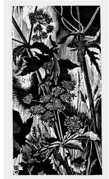
↗ Berce spondyle , 1969 Gravure sur bois de fil sur papier Musée Jenisch Vevey – Cabinet cantonal des estampes, Fondation Pierre Aubert