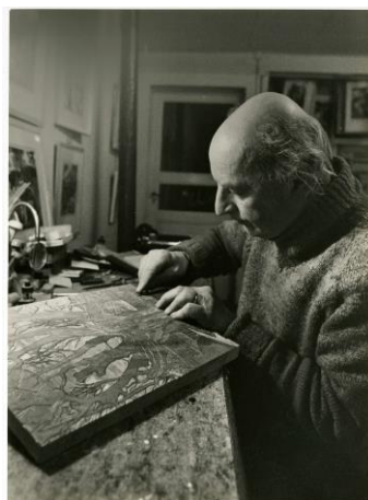
Pierre Aubert gravant L'Orée du bois , 1974