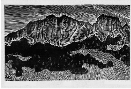
↑ Les Aiguilles-de-Baulmes , 1987 Gravure sur bois de fil sur papier japon, Musée Jenisch Vevey – Cabinet cantonal des estampes, Fondation Pierre Aubert