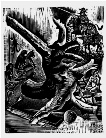
( Ma coquecigrue , 1974 Gravure sur bois de fil sur papier, 244 x 190 mm Musée Jenisch Vevey – Cabinet cantonal des estampes, Fondation Pierre Aubert

Cité par Philippe Kaenel, dans « 'J'ai toujours pensé l'un et l'autre' : Pierre Aubert, entre la gravure et la peinture », dans Pierre Aubert, peintre , Fondation Pierre Aubert, éditions Infolio, Gollion, 2024.