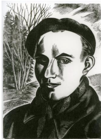
Autoportrait , entre 1936 et 1939 Gravure sur bois de bout sur papier, 330 x 238 mm Musée Jenisch Vevey – Cabinet cantonal des estampes, Fondation Pierre Aubert

En 1991, le Cabinet cantonal des estampes présentait une importante rétrospective de l'œuvre de Pierre Aubert au Musée Jenisch Vevey, quatre ans après son décès. Par la suite, l'artiste vaudois est régulièrement présent aux murs de l'institution, qui conserve depuis 1997 l'intégralité de son corpus gravé.