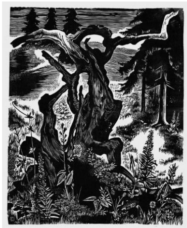
Vieux tronc , 1968 Gravure sur bois de fil sur papier, Musée Jenisch Vevey – Cabinet cantonal des estampes, Fondation Pierre Aubert

Ce thème de l'arbre traduit souvent des préoccupations intimes. Le Vieux tronc de 1968, l'une des pièces maîtresses de Pierre Aubert, est traité comme un portrait, voire un autoportrait. Il représente la douleur vécue à la suite d'actes successifs de vandalisme perpétrés dans la maison d'enfance de l'artiste.