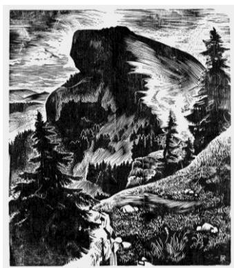
Le Chasseron , 1950 Gravure sur bois de bout sur papier Musée Jenisch Vevey – Cabinet cantonal des estampes, Fondation Pierre Aubert