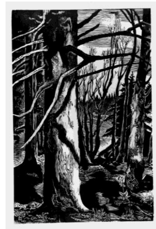
L'Orée du bois , 1972 Gravure sur bois de fil sur papier Musée Jenisch Vevey – Cabinet cantonal des estampes, Fondation Pierre Aubert