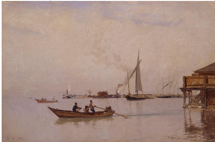
François Bocion, Le Port d'Ouchy , 1885, huile sur toile, 51,2 x 64,7 cm, Musée Jenisch Vevey, acquis par souscription en 1896