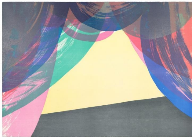
Ulla von Brandenburg, Scène , 2022, lithographie, 70 x 100 cm, Musée Jenisch Vevey, acquis par souscription en 2022